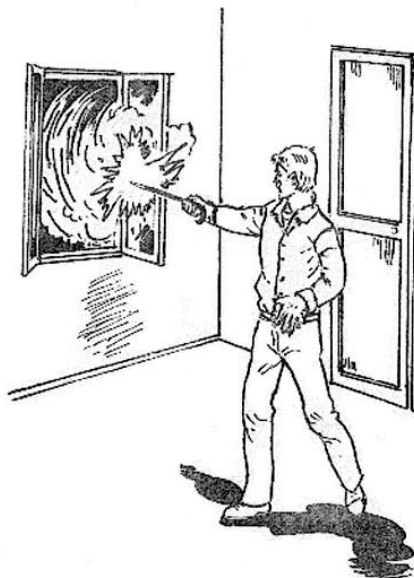
Empleo de las puntas

Así pues, uno puede protegerse rodeándose de puntas, exactamente como se protege una casa contra la electricidad, mediante el empleo de los pararrayos.