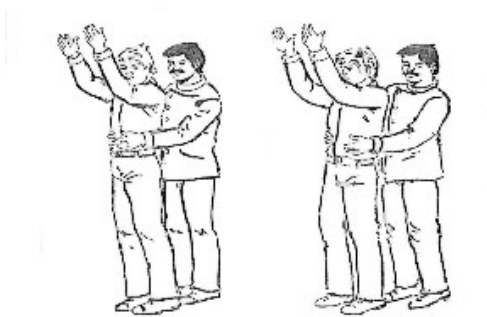
La desmagnetización del embrujado. Tiempos 1 y 2